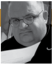
Dr. Olivier Buirette

Edi Rama est devenu Premier ministre de l'Albanie le 14 septembre 2013. Il succède ainsi à l'emblématique leader de l'Albanie post-communiste que fut Sali Berisha, premier président du pays de 1992 à 1997 puis Premier ministre de 2005 à 2013. Les commentateurs des années 2000 aimaient à dire sur cet homme d'État historique de l'Albanie moderne : « le pouvoir est toujours là où se trouve Sali Berisha, quel que soit la fonction qu'il occupe ».